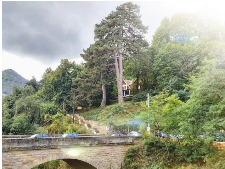
Слика 1: Кратовски борови стари 6 векови – споменици на природата во паркот “Карши Бавча”

Изработката на нов, ажуриран, реален и одржлив план беше повеќе од потребна. Новиот план за ЛЕР ќе претставува продолжение на претходната стратегија за ЛЕР од аспект на комплементарност на визијата, целите и активностите, подигајќи ги истите на едно повисоко ниво и земајќи ги во предвид новите локални, регионални и глобализациски текови и трендови.