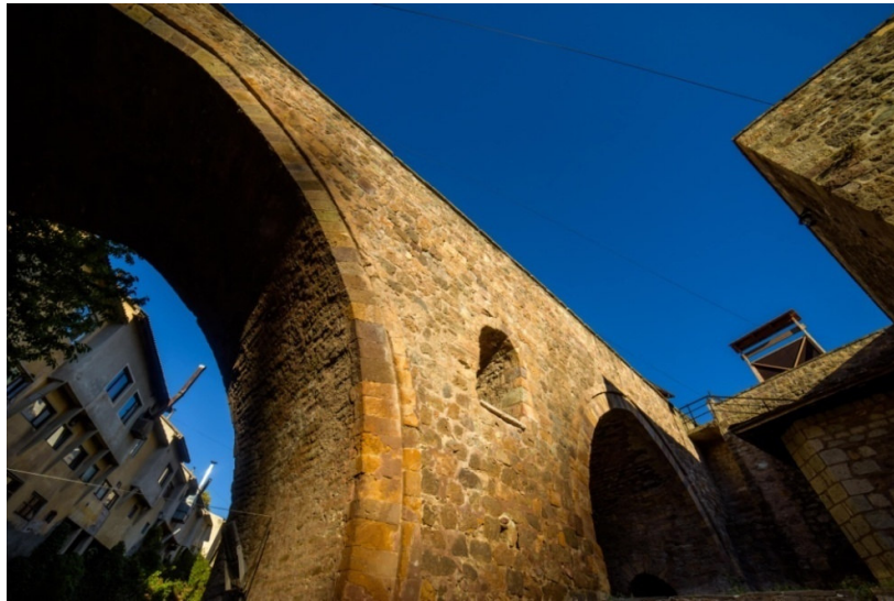
Слика 5: Грофчански Мост

Нечепнатата природа, чистиот воздух, староградската архитектура, културно-историските знаменитости, гостопримството и традиционалната кратовска трпеза, го вбројуваат оваа гратче во една од најпосакуваните и најпосетувани туристички дестинации во Македонија.