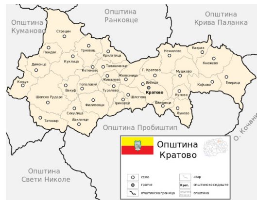
Слика 4: Населени места во Општината

Територијата на Општина Кратово зафаќа површина од 375,44км 2 или 1,48% од територијата на Република Северна Македонија. Според пописот на населението и домаќинствата во Република Северна Македонија од 2021 година, општина Кратово брои 7.968 жители, од кои 4.168 (52,3 %) се мажи и 3.800 (47,7 %) се жени. Густината на населеност изнесува 27,81 жит./км 2 . Населението од општината живее во 2.886 домаќинства. Најголем дел од населението во општината се Македонци 7.372 (92.5%), додека малцинствата се Роми 109 (1.4%), Срби 14 (0.2%), Власи 1 (0.01%), Албанци 9 (0.1%) и други 24 (0.3%).