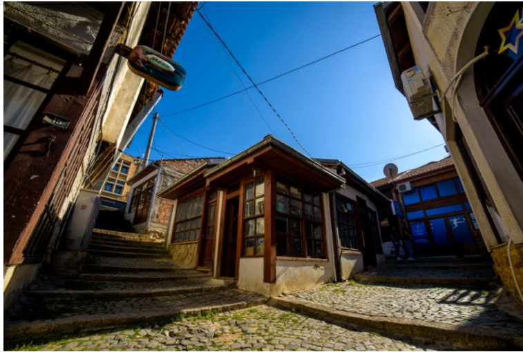
Слика 2: Ајдучка Чаршија

Принципите применети при дефинирање на оваа Стратегија се во согласност со Агендата 21 од конференцијата на Обединетите нации (ОН) за заштита на животната средина и поттикнување на економскиот развој (UNCED) одржана во 1992 година во Бразил.